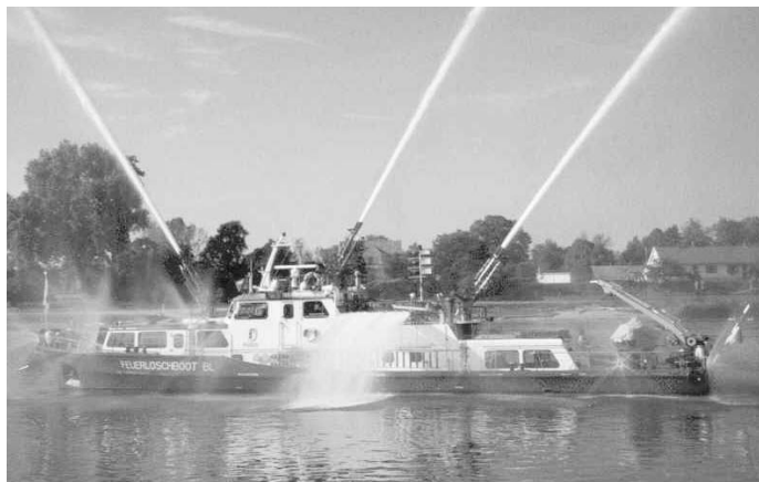
Feuerlöschboot Basel bei der Leistungsschau

Am 1. Oktober 2002 fand in Breisach am Rhein ein deutsch-französisches Expertentreffen in Verbindung mit einer eindrucksvollen Leistungsschau statt, bei der sich die politisch Verantwortlichen über die Leistungsmöglichkeiten der am Rhein verfügbaren Boote informierten. Neben den Booten der Wasserschutzpolizei, der Feuerwehren und anderer Hilfsorganisationen war das eigens aus Basel angereiste Feuerlöschboot ein besonderer Publikumsmagnet. Die eindrucksvoll dargestellten Einsatzmöglichkeiten des Feuerlöschbootes haben wertvolle Überzeugungsarbeit geleistet.